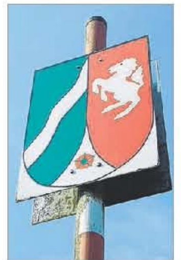
... als auch nordrhein-westfälischen Boden. Insgesamt sind es über 38 Kilometer.

bläser auf, die nachmittags von der Sauerlandmusikanten abgelöst werden. Ab 15 Uhr können