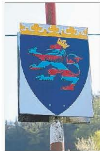
Wer den Rotmilan-Höhenweg geht, berührt sowohl hessischen ...

Wer nach so viel Bewegung Hunger verspürt, kann ab 11 Uhr in allen fünf Orten ordentlich zulangen. In Diedenshausen spielen vormittags die Jagdhorn-